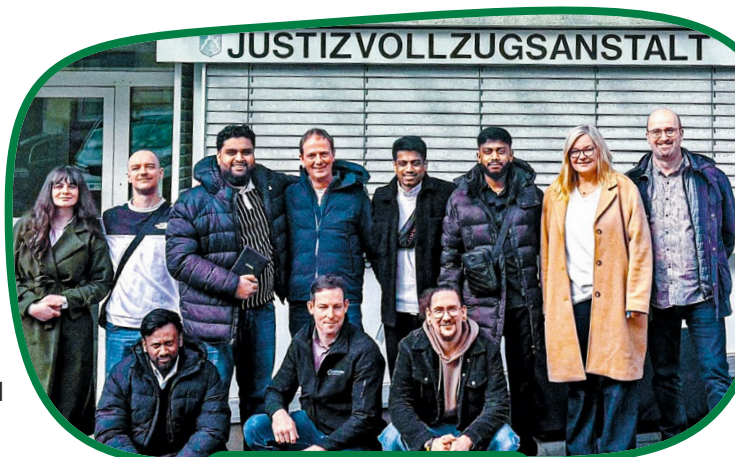
Team der IMC in der JVA Hagen