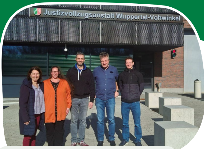
Gottesdienst am 1. März mit dem Team von NEUSTART Breitscheid und ca. 40 inhaftieren Männern in der JVA Wuppertal-Vohwinkel